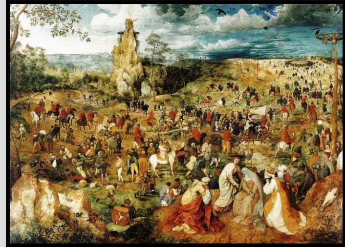
La Procesión al Calvario (1564), Pieter Bruegel.

La obra explora a partir del proceso inquisitorial a un excéntrico molinero de Friuli llamado Menocchio , todo el clima religioso y las discusiones espirituales y cosmogónicas que se estaban dando en esa zona de Italia durante el siglo XVI. Esto a partir de los testimonios de Menocchio durante los casi diez años que duró su proceso. Allí también, paradójicamente, se pueden entrever las redes lectura y el tránsito de libros que existía en esa zona rural de Italia.